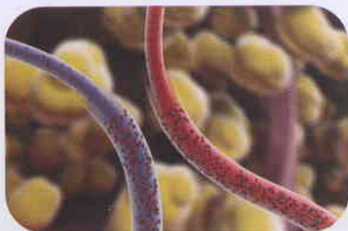
(Figure - 03)