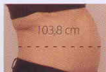
Après 4 Traitements

Réduction graisseuse au niveau du ventre et raffermissment cutané