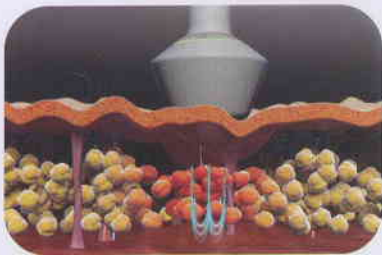
(Figure - 01)