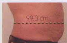
Après 3 Traitements

Réduction graisseuse au niveau du ventre et raffermissment cutané