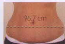
Après 3 Traitements