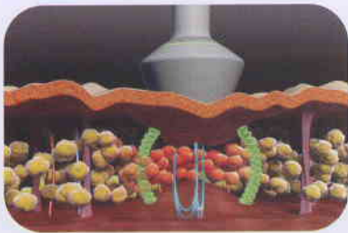
(Figure - 02)